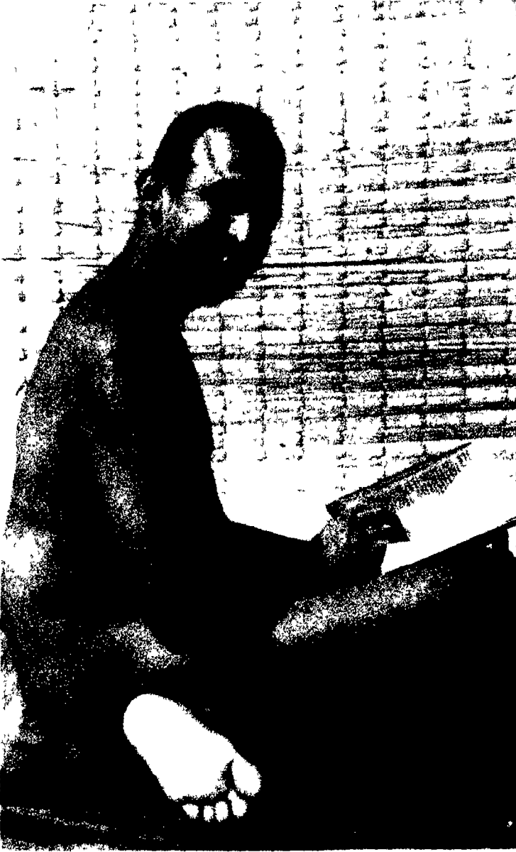
परमपूज्य उपाध्याय ज्ञानसागरजी महाराज